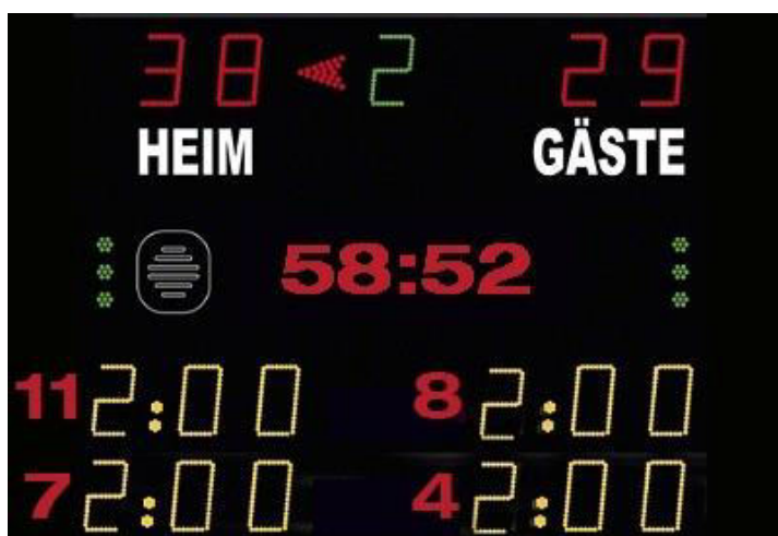
Abbildung 1: Beispiel Anzeigetafel

Das Anzeige-System in der Spielstätte muss eine öffentliche Zeitmessanlage sein, die von den Zuschauerplätzen und insbesondere vom Zeitnehmertisch ohne Einschränkungen eingesehen werden kann. Werden auf der Anzeigetafel Zeitstrafen angezeigt, so müssen mindestens zwei Hinausstellungen pro Verein inkl. Spielernummer und Strafzeit (siehe Abbildung 1) angezeigt werden können. Sollte dies nicht möglich sein, so ist bei Hinausstellungen die Zeit des Wiedereintritts inkl. Spielernummer jeweils auf einem Vordruck in Papierform einzutragen und sichtbar anzubringen.